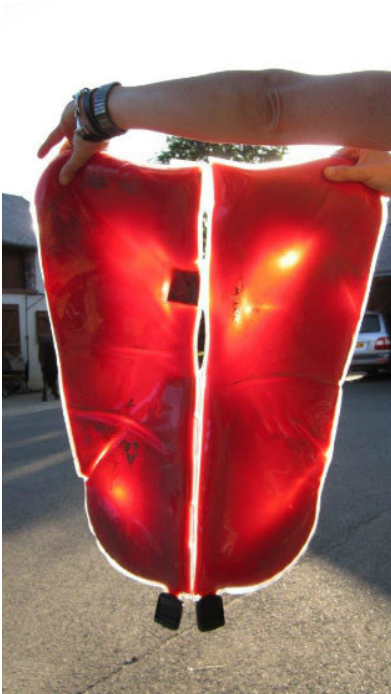
Photo du haut : le pad se place directement sous la selle pendant le travail.

Photo du bas : après 30 min, ce test révèle de fortes pressions dissymétriques au niveau du garrot (haut de l'image) et un point de surpression à l'arrière.